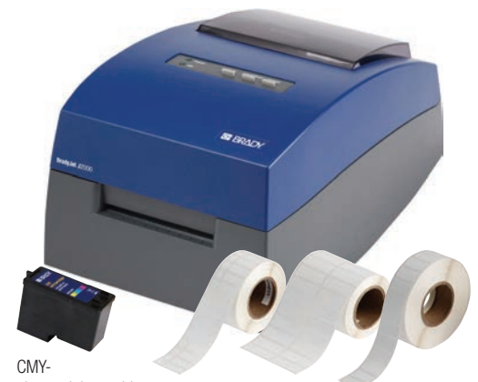
CMY-pigmentinkcartridge voor J2000-printer